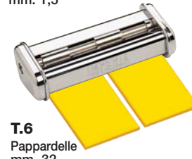
T.6 Pappardelle mm. 32