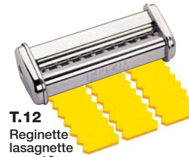
T.12 Reginette lasagnette mm. 12