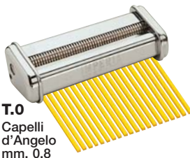
T.0 Capelli d'Angelo mm. 0,8