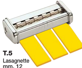
T.5 Lasagnette mm. 12