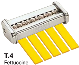
T.4 Fettuccine mm. 6,5