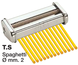
T.S Spaghetti Ø mm. 2