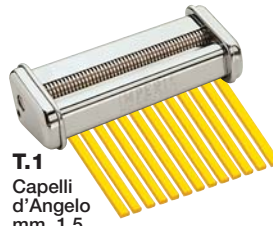
T.1 Capelli d'Angelo mm. 1,5