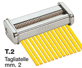
T.2 Tagliatelle mm. 2