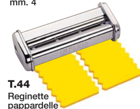
T.44 Reginette pappardelle mm. 44