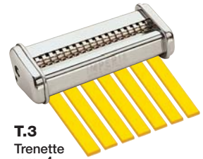
T.3 Trenette mm. 4